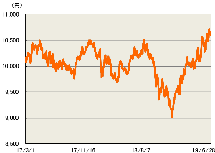
上記グラフは、過去の実績を示したものであり、将来の成果を保証するものではありません。基準価額は信託報酬控除後のものです。