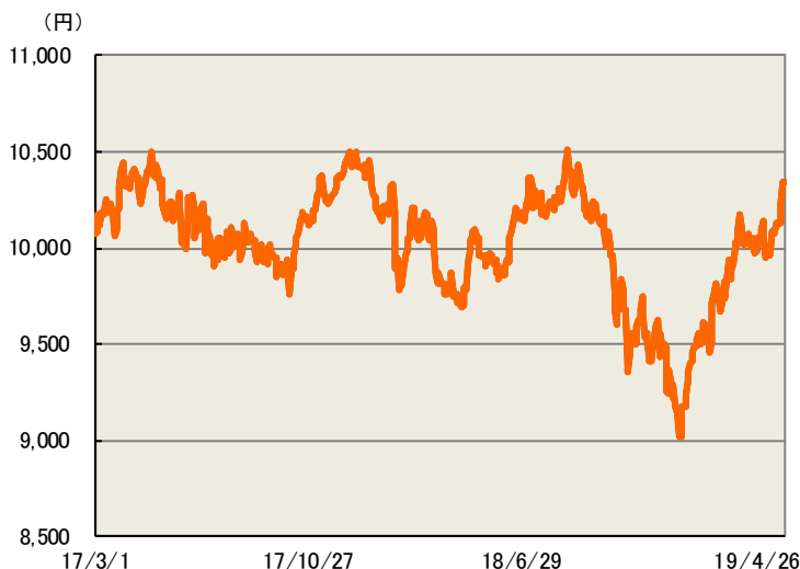
上記グラフは、過去の実績を示したものであり、将来の成果を保証するものではありません。基準価額は信託報酬控除後のものです。